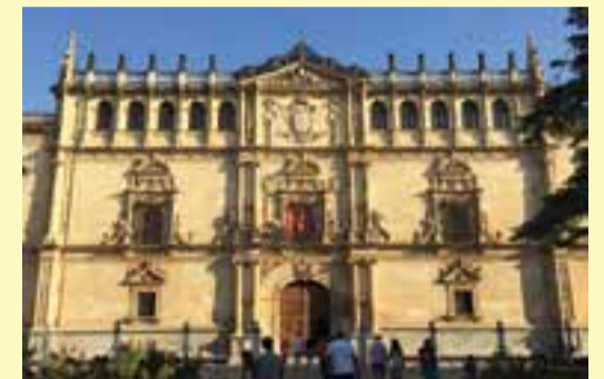
главное здание Университета

Маша: Учиться интересно, преподаватели отличные и хорошо излагают материал. Однако, нагрузка очень большая и, к сожалению, у нас практически не остается времени на путешествия и развлечения.