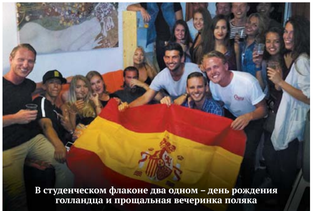
В студенческом флаконе два в одном – день рождения голландца и прощальная вечеринка поляка